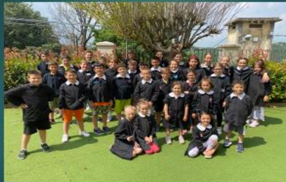
Primaria di I° grado San Giorgio Monferrato